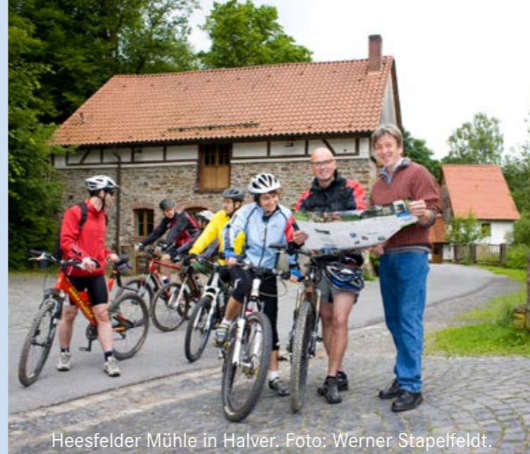
Heesfelder Mühle in Halver.