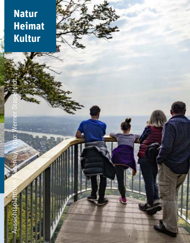
Aussichtsplattform Rabenlay.