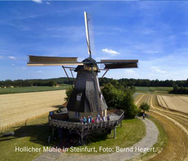
Hollicher Mühle in Steinfurt, Foto: Bernd Hegert.