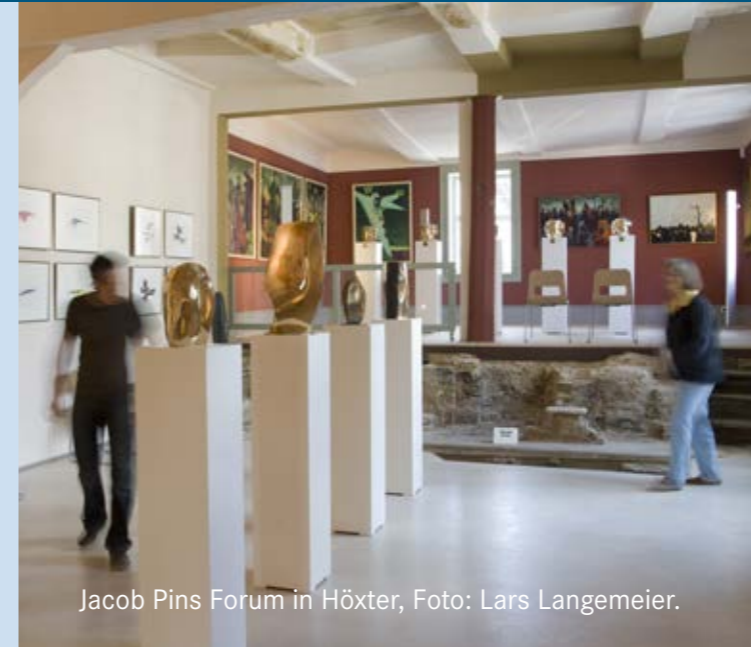
Jacob Pins Forum in Höxter, Foto: Lars Langemeier.

Außerdem fördert sie die Einrichtung von regionalgeschichtlichen Museen, den Erwerb von bedeutenden Kulturgütern und Zeugnissen unserer reichen Landesgeschichte.