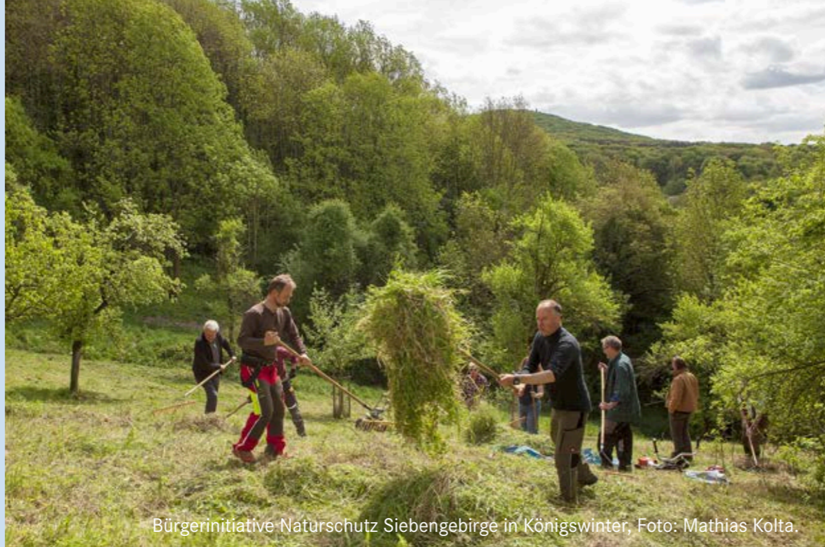
Bürgerinitiative Naturschutz Siebengebirge in Königswinter

Ihre Aufgaben finanziert die NRW-Stiftung überwiegend aus Lottereerträgen über den Landeshaushalt. Immer wichtiger sind aber auch die Spenden und Mitgliedsbeiträge der Partner und Mitglieder im Förderverein NRW-Stiftung, der die Arbeit der Stiftung finanziell und ideell unterstützt.